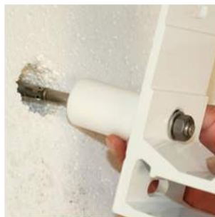
④ utilizzo con tassello