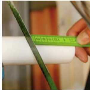
② taglio a misura del distanziale