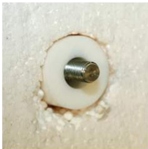
④ utilizzo con barra filettata