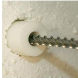
③ inserimento distanziale e foratura della muratura