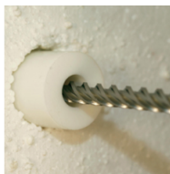
③ inserimento distanziale e foratura della muratura