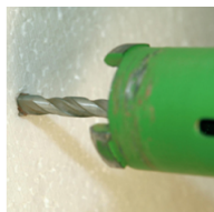
① foratura del cappotto