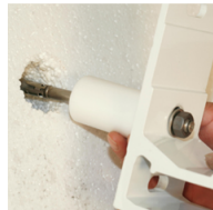
④ utilizzo con tassello