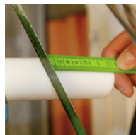
② taglio a misura del distanziale